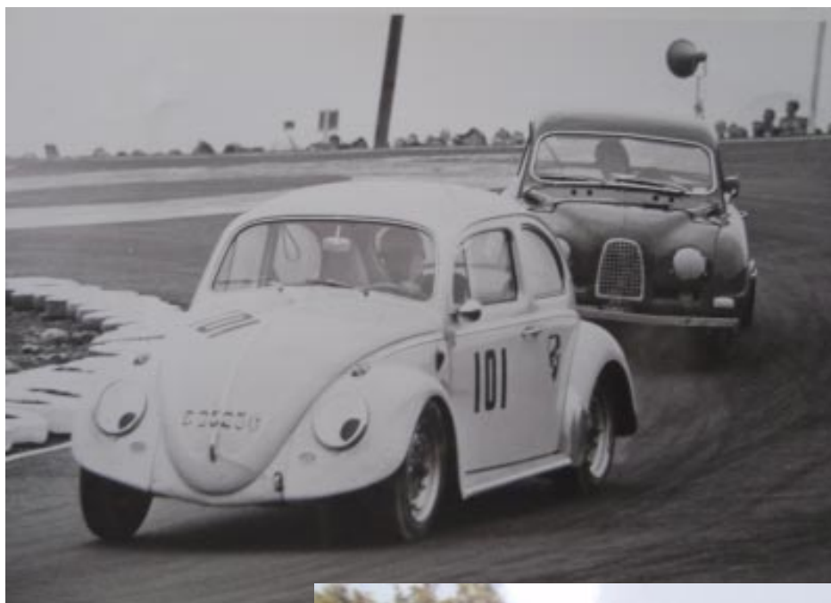
Roland har tagit täten. Porsche 356-fälgarna med Dunlop Racing håller greppet och bilen håller ögonen på vad konkurrenterna har för sig.