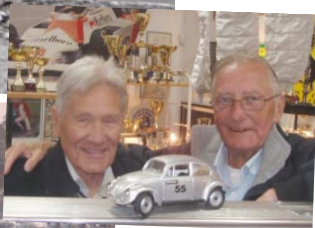
T v: VW:n kom att följas av en DKW F12 tävlingsåret 1964.